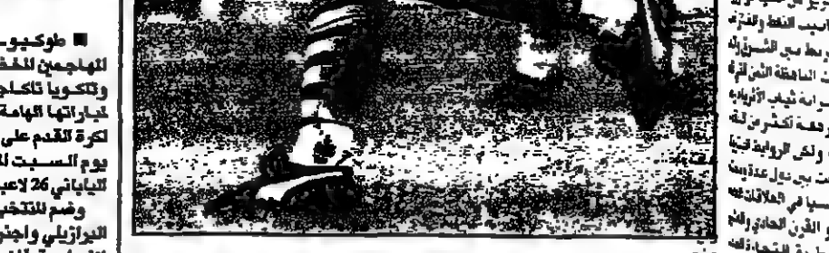
دييغو مارادونا في اثناء مباراة في الدوري الانكليزي.

الرياض - ا.ب. - قال دييغو مارادونا انه لن يعود للعب الاحترافي في كرة القدم.